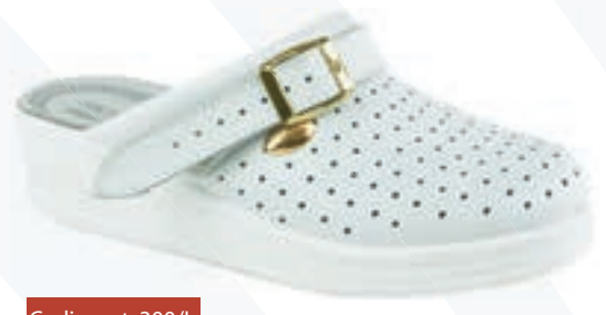
Codice art. 300/L