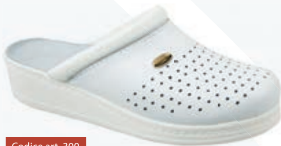
Codice art. 300

Available in white and blue colors, in simple version or with back strap.