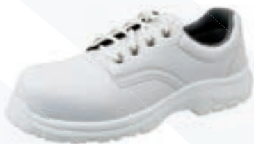
Codice art. 100/O