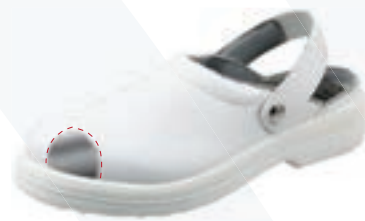
Codice art. 100/S

Su richiesta colore nero Black color or request