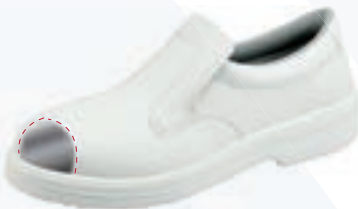
Codice art. 102/S ● ○