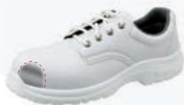
Codice art. 101/S