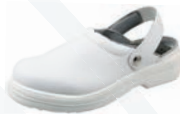
Codice art. 102/O