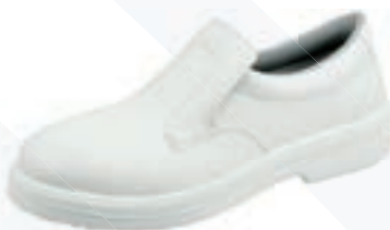
Codice art. 101/O