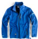
I0340B BLU COBALTO