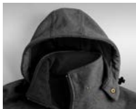
CAPPUCCIO STACCABILE REGOLABILE CON COULISSE

3 TASCHE ESTERNE CON CERNIERA ELASTICO AI POLSI ED IN VITA INTERNO IN PILE