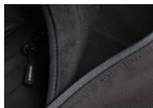
INTERNO IN PILE