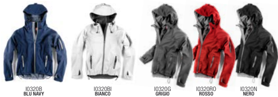
I0320B BLU NAVY