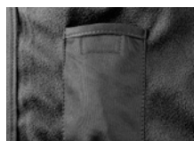
TASCA INTERNA PORTACELLULARE

CHIUSURA CENTRALE CON CERNIERA 2 TASCHE LATERALI CON CERNIERA TASCA CON CERNIERA LATO SUPERIORE DESTRO CON CHIUSURA IN VELCRO COULISSE REGOLABILE IN VITA