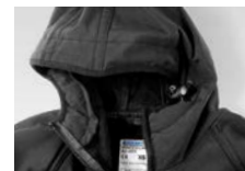
CAPPUCCIO FISSO REGOLABILE CON COULISSE

T-SHIRTS POLO FELPE PILE PANTS SOFTSHELL GILET GIUBBOTTI PARKA ALTA VIS. WORK