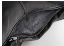
AERAZIONE RETINATA SOTTO LE ASCELLE