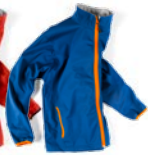
E0101R BLU ROYAL/ARANCIO FLUÒ

T-SHIRTS ■ POLO ■ FELPE ■ PILE ■ PANTS ■ SOFTSHELL ■ GILET ■ GIUBBOTTI ■ PARKA ■ ALTA VIS. ■ WORK ■