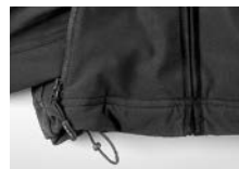
COULISSE REGOLABILE IN VITA