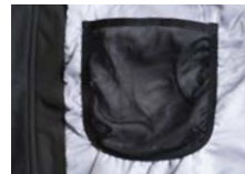
TASCA INTERNA RETINATA LATO DESTRO