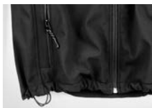
COULISSE REGOLABILE IN VITA