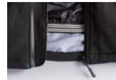
FASCIA ELASTICIZZATA DI CHIUSURA INTERNA IN VITA

T-SHIRTS ■ POLO ■ FELPE ■ PILE ■ PANTS ■ SOFTSHELL ■ GILET ■ GIUBBOTTI ■ PARKA ■ ALTA VIS. ■ WORK ■