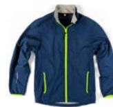
E0101B BLU NAVY/VERDE FLUÒ